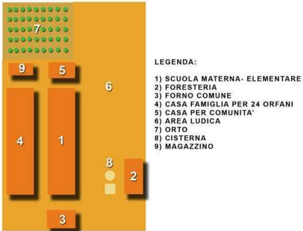
Fig.1 - schema del progetto del villaggio CIEL