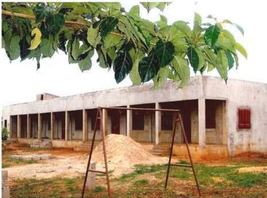
Fig.3 – fabbricato 1 scuola materna elementare, prevista sopraelevazione