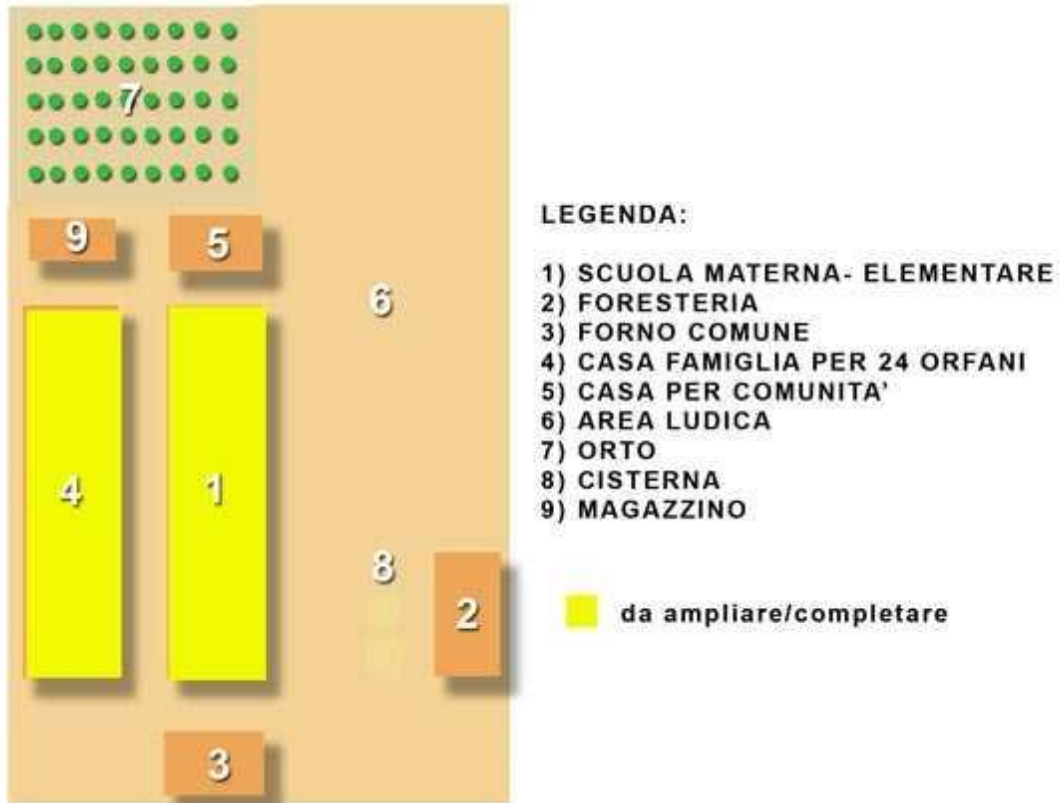
Fig.2 - schema dei fabbricati da completare