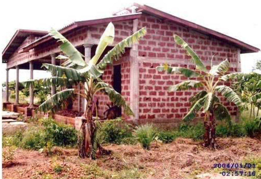
Fig.4 – fabbricato 2, foresteria - mensa